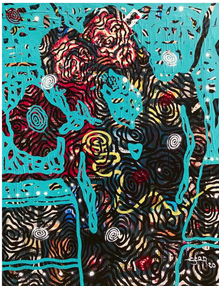
Les princes de la cité, 2020

"Cette exposition collective devient le théâtre de la naissance et de l'évolution des liens qui se créent entre les œuvres et celui qui les regarde, entre les artistes dont les univers se rencontrent, s'entrecroisent et s'entrechoquent pour présenter un panorama d'histoires atypiques et offrir une expérience visuelle et humaine enrichissante" confie la galerie .