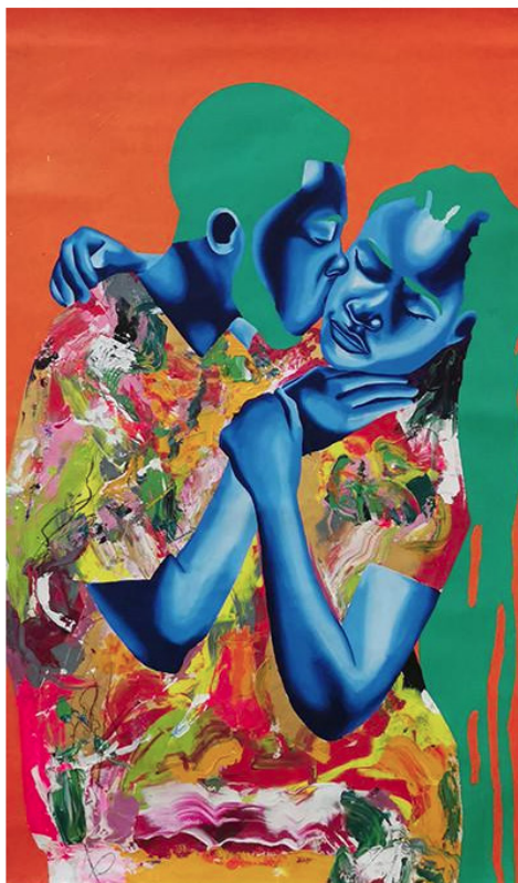
Johnny boy's first kiss, 2021

Obodjé né en 1992 en Côte d'Ivoire est un artiste autodidacte. Ses influences viennent des mythes, légendes et pratiques de son peuple (les Akans). Son style est brut et se veut "indemnes d'influences issues de la tradition artistique ou de références académiques". La forme de ses personnages se dissout dans l'évocation de la densité des paysages, des forêts, de l'eau, de la nuit... L'artiste devient alors le messager d'un monde qui s'efface, mais dont il entend partager les profondes valeurs humanistes et universelles. OBODJE