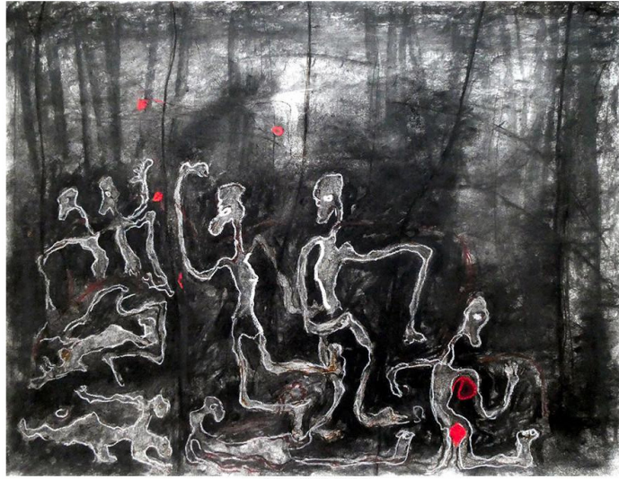
Danse de la forêt, 2019