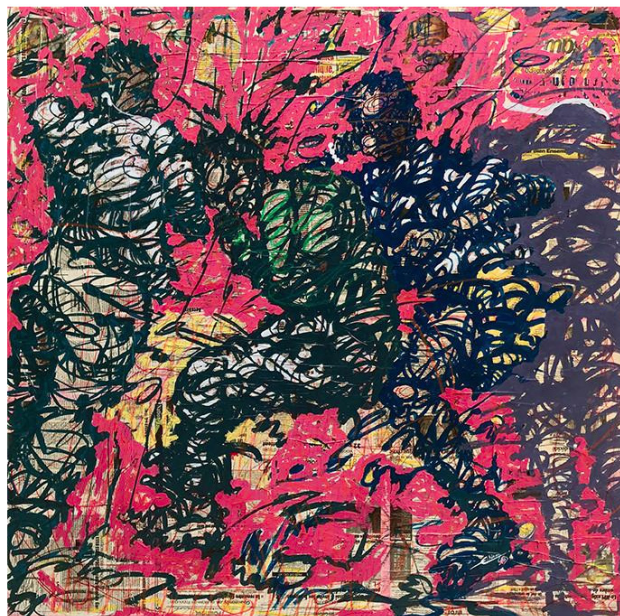
Couchés en plein air, 2020