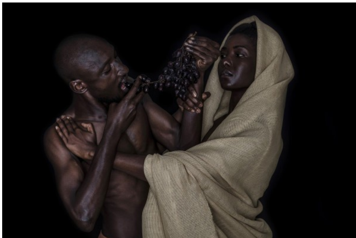
Alun Be, Evol Series - Forbidden Fruit (2021) Archival pigments on FineArt paper, 80x120cm