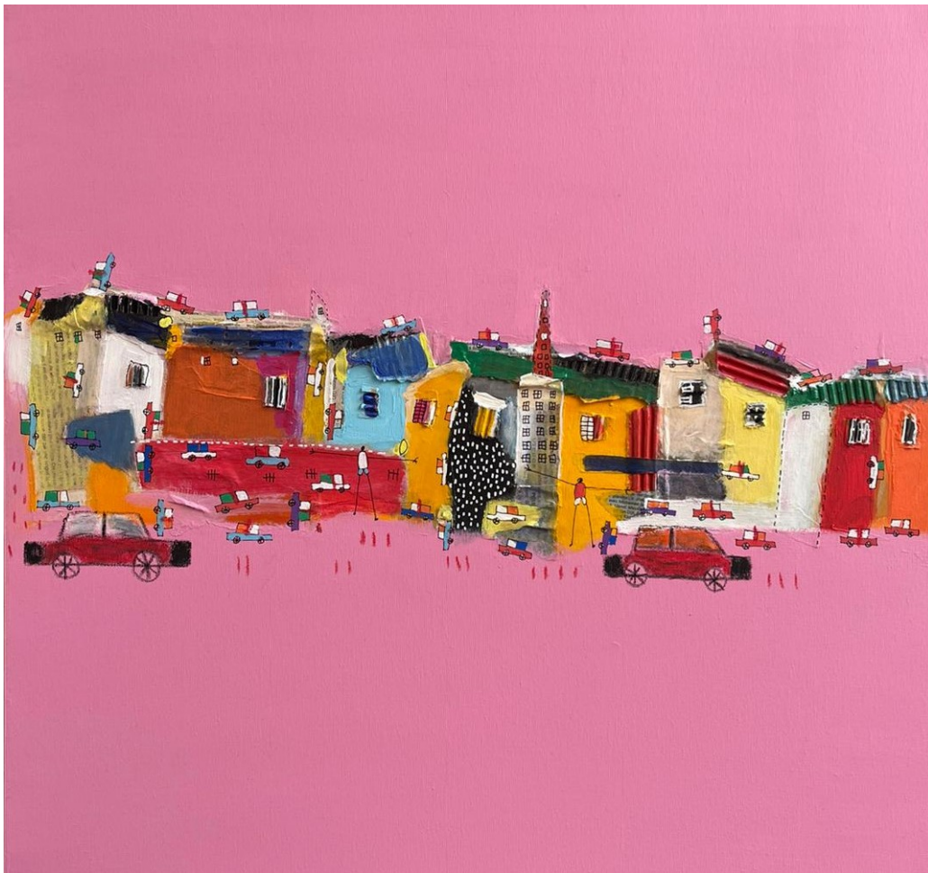
N'doye Douts, Ndieugueune (2021) 70x70cm, Collage, pastel, acrylique sur toile

Douts s'est rapidement distingué dans divers ateliers ou biennales et lors de la projection de son court-métrage "Train-Train Médina", qui évoque la construction et la fragile déconstruction d'une ville sur le sable. Il est également sculpteur mais la peinture, reste sa discipline de prédilection.