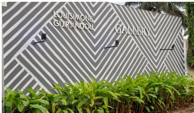
La façade de LouiSimone Guirandou Gallery à Abidjan.

Un bel hommage pour symboliser cet espace moderne, attenant à la villa LouiSimone Guirandou, qui recouvre aujourd'hui la piscine et une partie du jardin. Ce lieu est une invitation adressée à une nouvelle génération de collectionneurs.