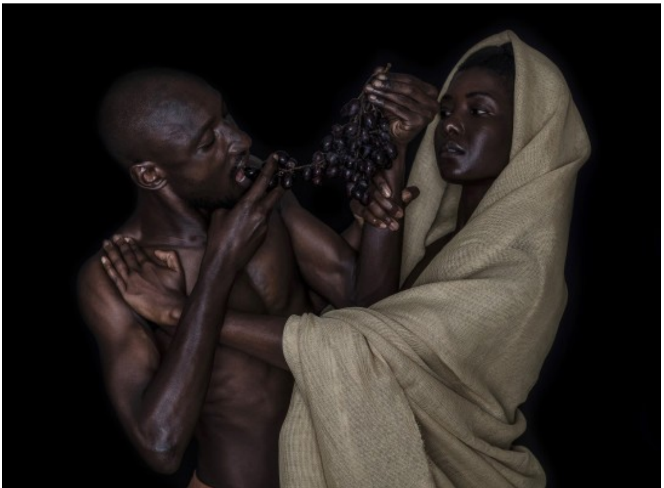
Détail de l'œuvre Alun Be, Evol Series - Forbidden Fruit (2021) Archival pigments on FineArt paper, 80x120cm

LouiSimone Guirandou Gallery, Abidjan 24 février > 9 avril 2022