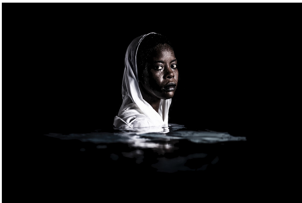
Alun Be, Evol Series - Out of water (2019) Archival pigments on fine art paper, 80 x 120 cm, Edition of 5 plus 2 AP, © Alun Be courtesy LouiSimone Guirandou Gallery