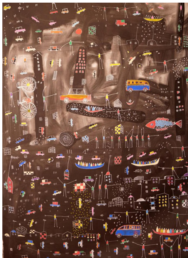
Ndoye Douts, Mouvementé (2022), 132x97cm, acrylique et posca sur toile