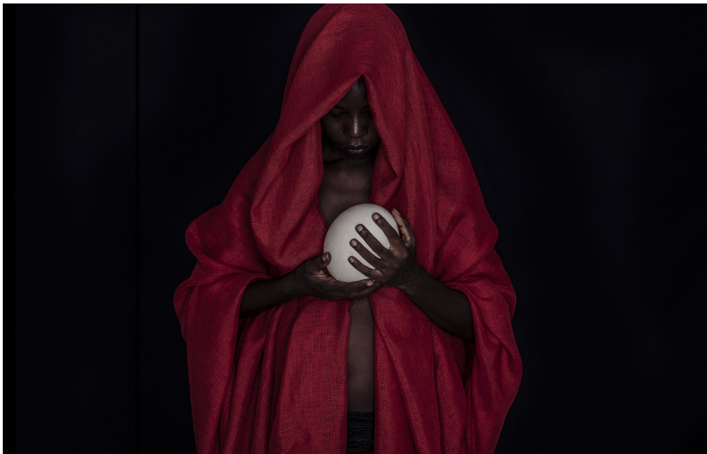
Alun Be, Evol Series - Alpha (2019) Archival pigments on fine art paper, 80 x 120 cm, Edition of 5 plus 2 AP © Alun Be, courtesy LouiSimone Guirandou Gallery