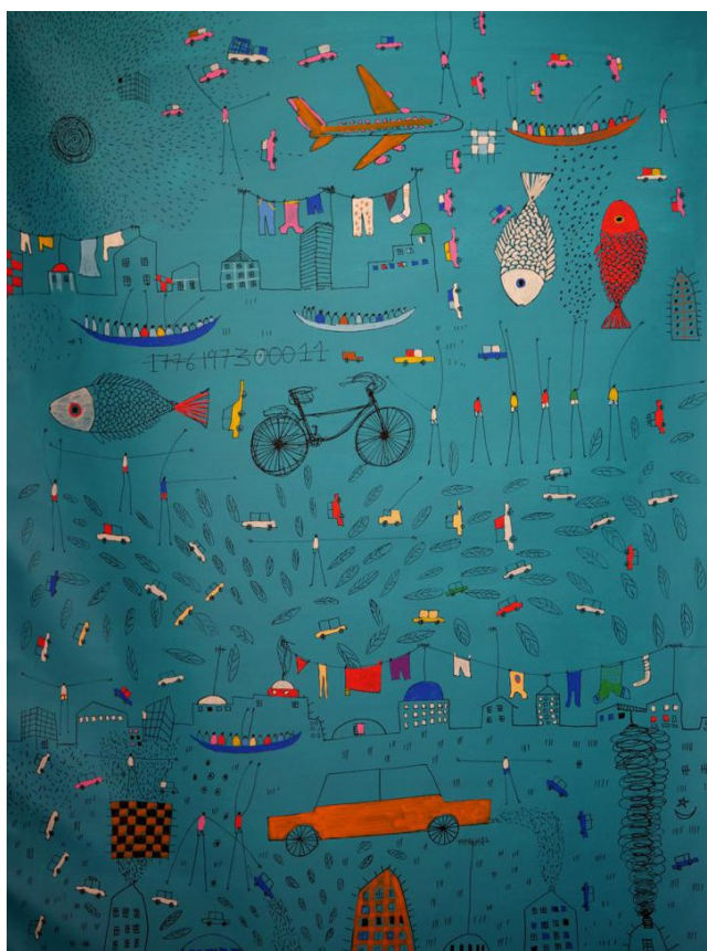
Ndoye Douts, Identité (2022), 132x97cm, acrylique et posca sur toile