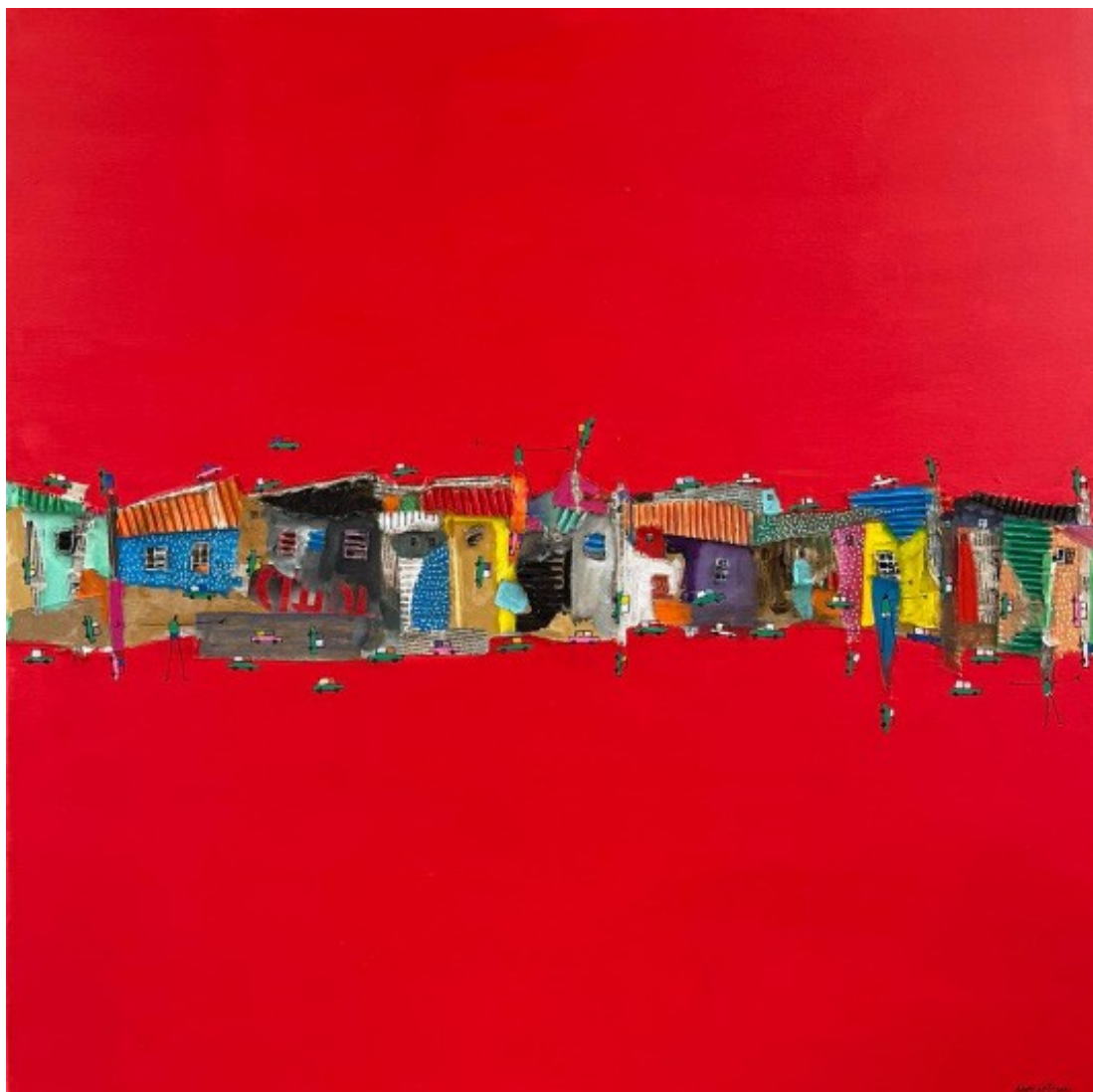
Dhara (2021), Ndoye Douts, 100x100 cm, Collage, pastel, acrylique sur toile