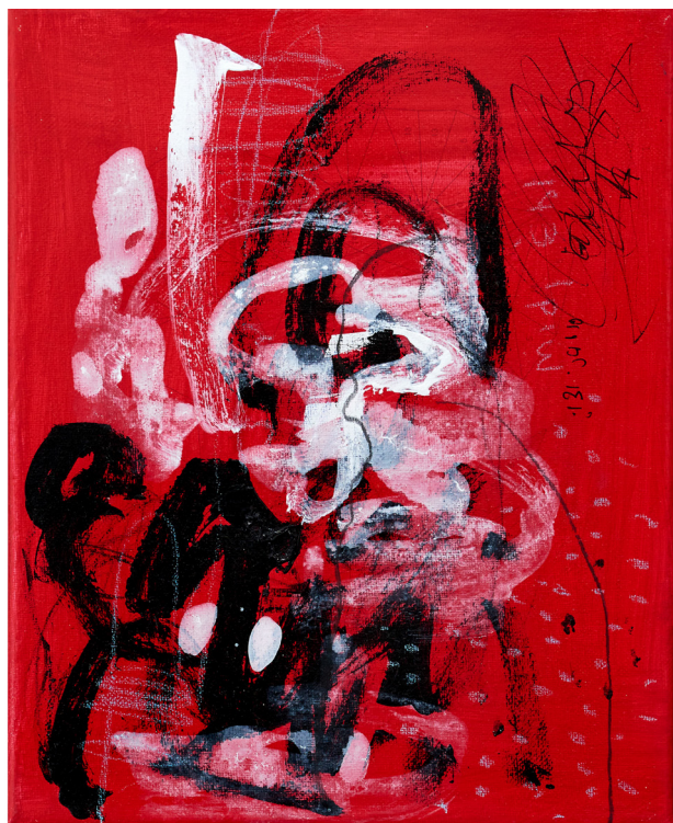
Scripture story, red 1, Sess Essoh, (2021) - Acrylique sur toile, 23 x 29 cm