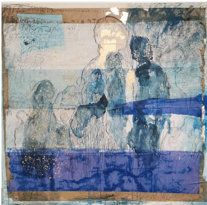
Cardinals' council 1 (2021), Sess Essoh - Acrylique, pastels, feuilles d'or sur papier maroufflé sur toile, 230 x 240 cm