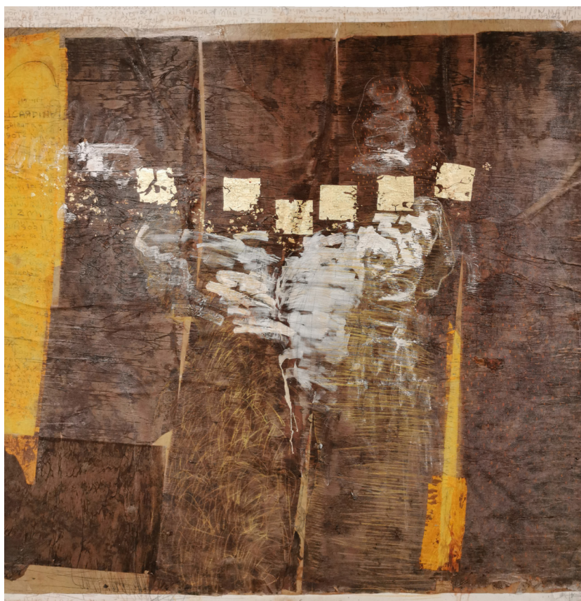
Cardinals' council 3 (2021), Sess Essoh - Acrylique, pastels, feuilles d'or sur papier maroufflé sur toile, 230 x 240 cm