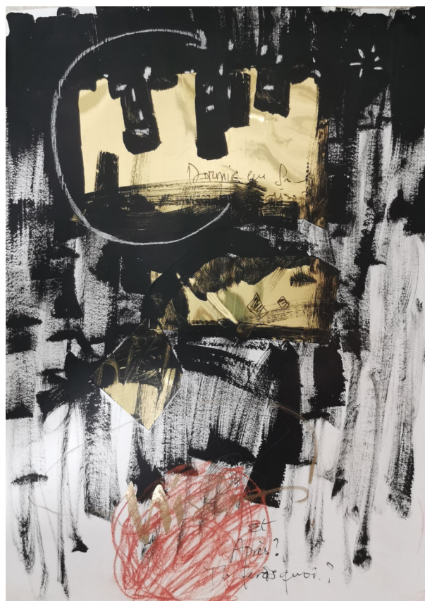
Et après tu feras quoi (2021), Sess Essoh, pastel, acrylique et feuille d'or sur papier, 21 x 29 cm