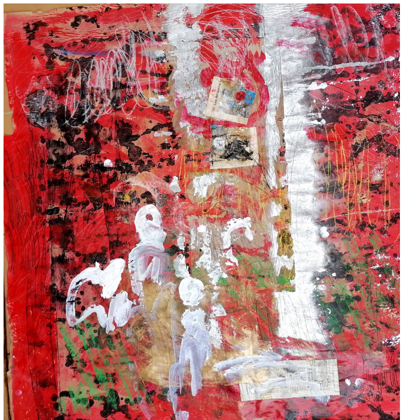
Vertigo Jazz, Sess Essoh, dirty things 2 (2021) - Acrylique et pastels sur carton marouflé sur toile, 100 x 100 cm