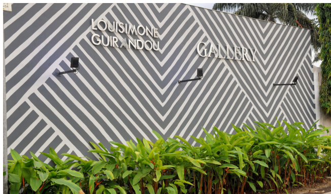
La façade de LouiSimone Guirandou Gallery à Abidjan.

Un bel hommage pour symboliser cet espace moderne, attenant à la villa LouiSimone Guirandou, qui recouvre aujourd'hui la piscine et une partie du jardin. Ce lieu est une invitation adressée à une nouvelle génération de collectionneurs.