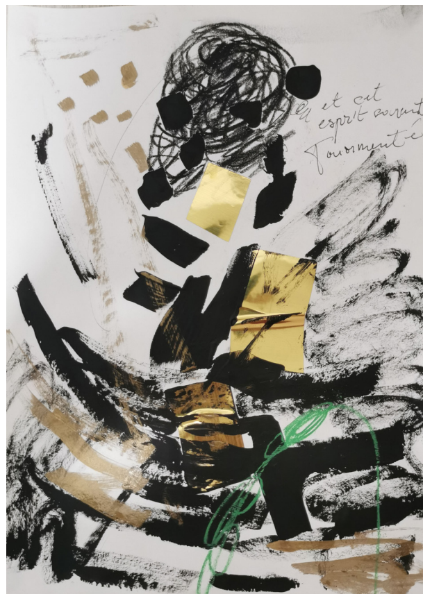
Et cet esprit souvent tourmenté (2021), Sess Essoh, pastel, acrylique et feuille d'or sur papier, 21 x 29 cmsur toile.