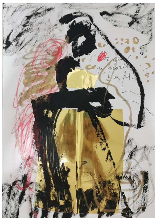
L'or que je porte en moi (2021), Sess Essoh, pastel, acrylique et feuille d'or sur papier, 21 x 29 cm