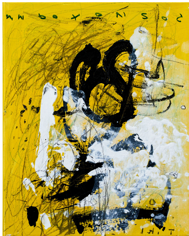
Scripture story, yellow 1, Sess Essoh, (2021) - Acrylique sur toile, 23 x 29 cm