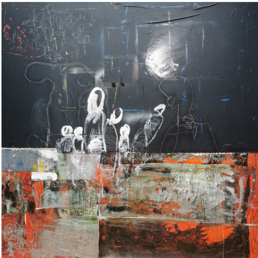
Au seuil de la cité idéale, Sess Essoh, (2021), technique mixte sur toile, 160 x 160 cm. © Sess Essoh, courtesy LouiSimone Guirandou Gallery