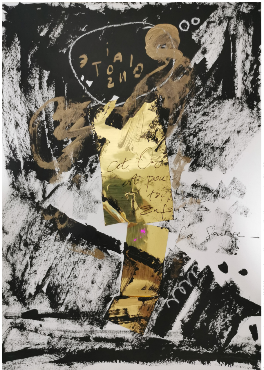
Cet or est pour toi mon enfant (2021), pastel, acrylique et feuille d'or sur papier, 21 x 29 cm