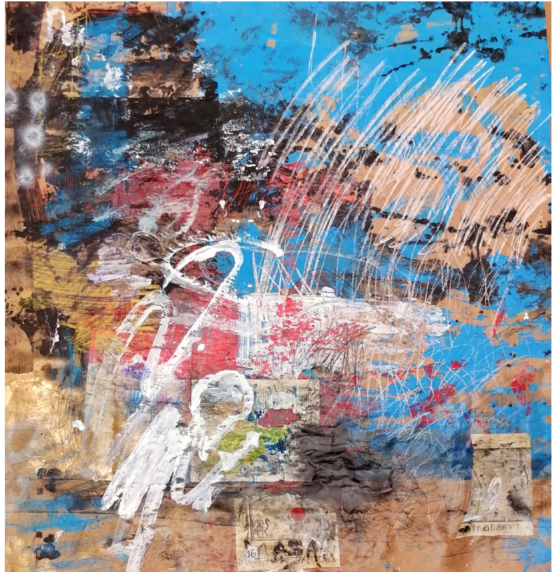
Vertigo Jazz, Sess Essoh, dirty things 1 (2021) - Acrylique et pastels sur carton marouflé sur toile, 100 x 100 cm